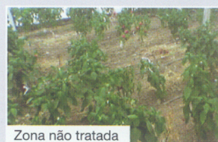
Zona não tratada