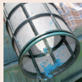
Problemas habituales de los oxiclóruros con los foliares