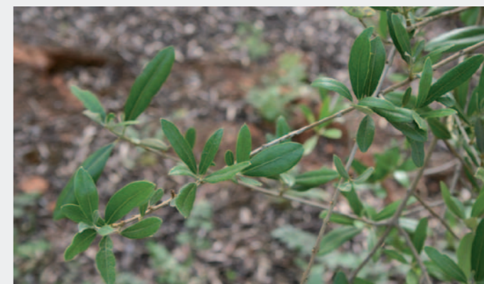
Cobre + TACTIC: Mejor control de la enfermedad y efecto estimulante sobre la vegetación