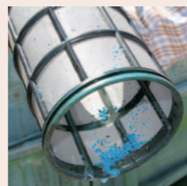
Problemas habituales de los oxiclорuros con los foliares