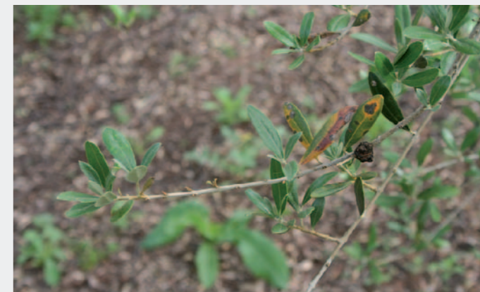
Aspecto de una rama tratada SOLO con cobre