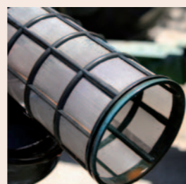
Sin problemas de obstrucciones en las mezclas con NORDOX