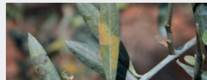
Con frecuencia, los tratamientos con cobre solo no son suficientes para impedir la aparición de enfermedades